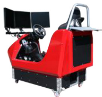
Evenkit Services Simulateur Barracuda G25

Les 10 commandements de l'écoconduite seront enseignés et s'adapteront aussi bien à la conduite d'un véhicule électrique que d'un véhicule thermique.